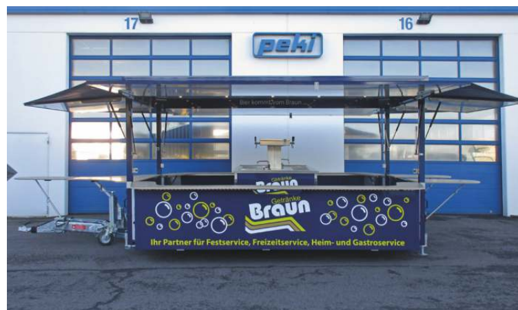
Typ 4500/8 AS mit absenkbarem Fahrgestell