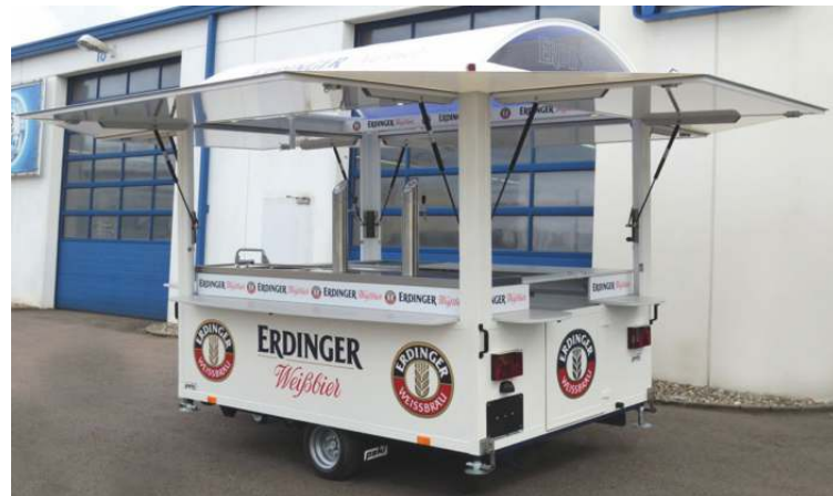
Typ 2700 KD mit Kuppeldach